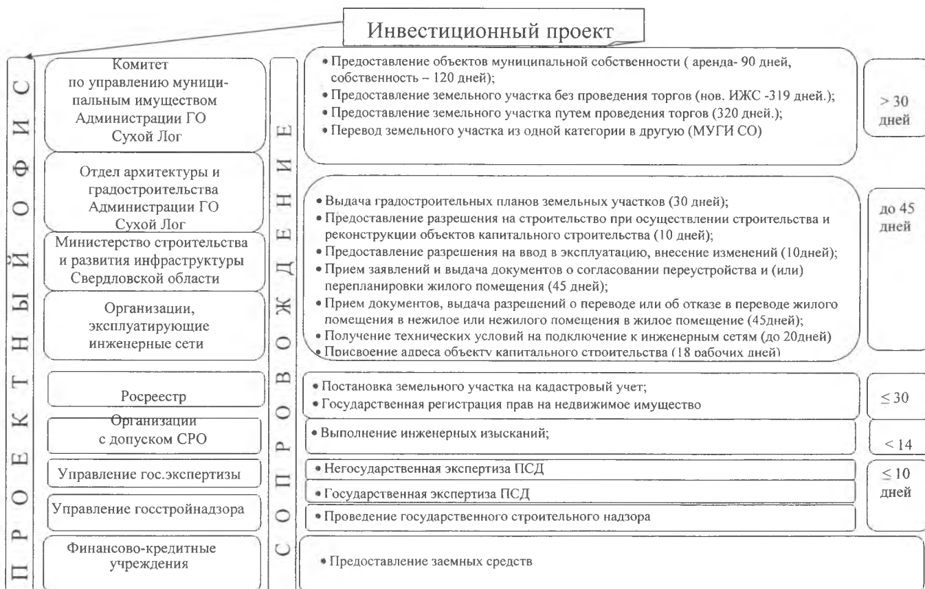
Схема сопровождения инвестиционных проектов в городском округе Сухой Лог

Приложение № 4 к Регламенту сопровождения инвестиционных проектов в городском округе Сухой Лог, утвержденного постановлением Главы городского округа Сухой Лог от 29 АЕИ 2015 № 2 8 9 4 - III