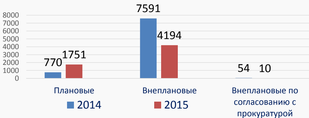
Информация о проведении проверок хозяйствующих субъектов, зарегистрированных на территории Свердловской области

Процент внеплановых проверок, согласованных с прокуратурой, 0,2 %